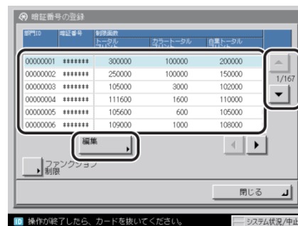
集計確認画面（本体操作部側）