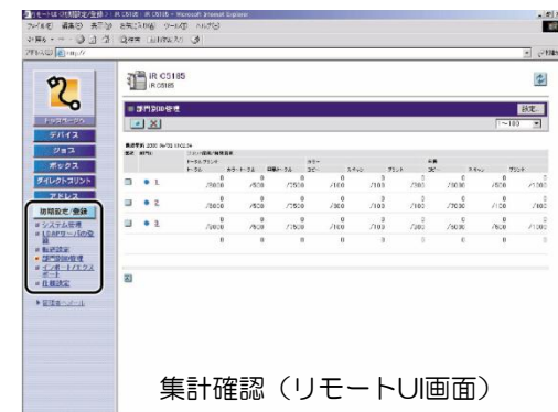
集計確認（リモートUI画面）